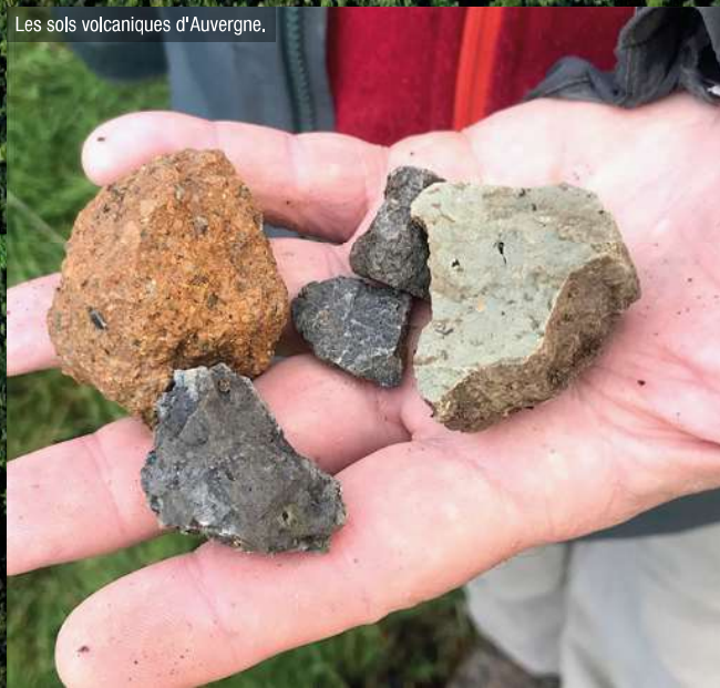
Les sols volcaniques d'Auvergne.

Professionals agree on a common typicity. John Szabo* defines it as balancing between salinity, minerality and bitterness. The soil of each volcano develops its own characteristics. Charles Frankel** certifies that "each volcano has its own imprint, its own wines". For a sommelier, the panel becomes precious, in all three colours. The pairings can be imagined from the starter to the dessert, without forgetting the cheeses in their diversity.